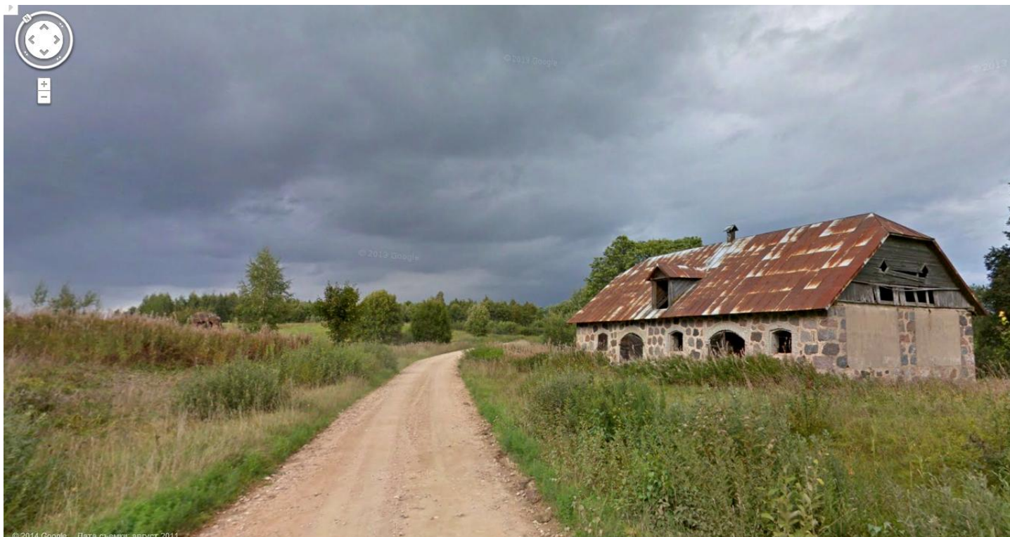
Амбар, как памятник у дороги (сегодняшнее фото от Карты Google).