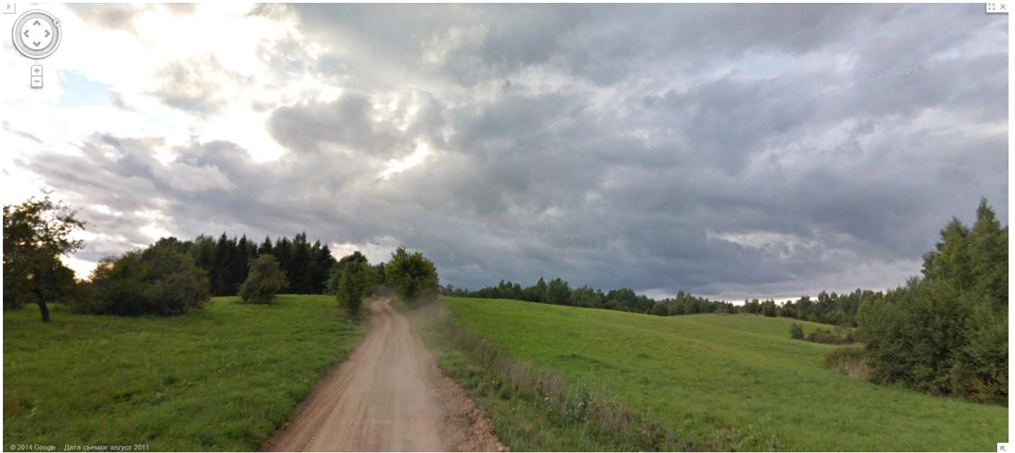
сегодняшнее фото