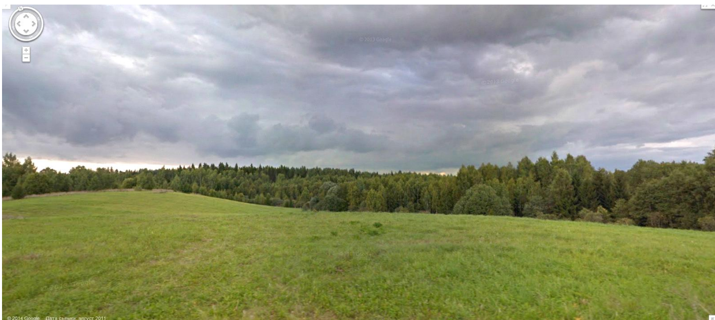
Деревья с тех пор заметно подросли (сегодняшнее фото от Карты Google).

Зубья культиватора в пашне, бороны наготове. Вперед, на верхушки деревьев!