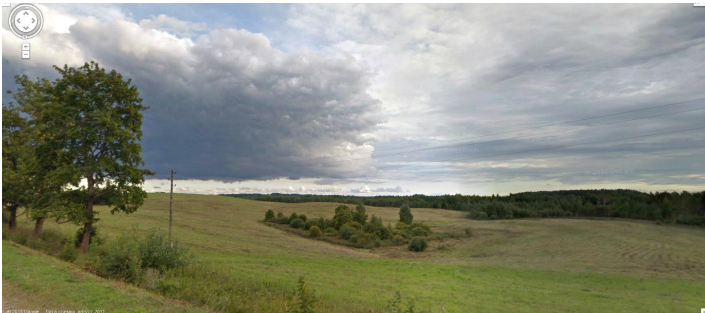
Те поля (сегодняшнее фото от Карты Google).

Обработка их хуторских наделов попутно была и нашей заботой. Много таких огородов мы на своих «гусаках» прошерстили. Как водится, хуторяне не забывали отблагодарить: кто «зелененькую» в руку сунет, кто «синенькую», кто бутылком с ядрёненьким собственного производства снабдит.