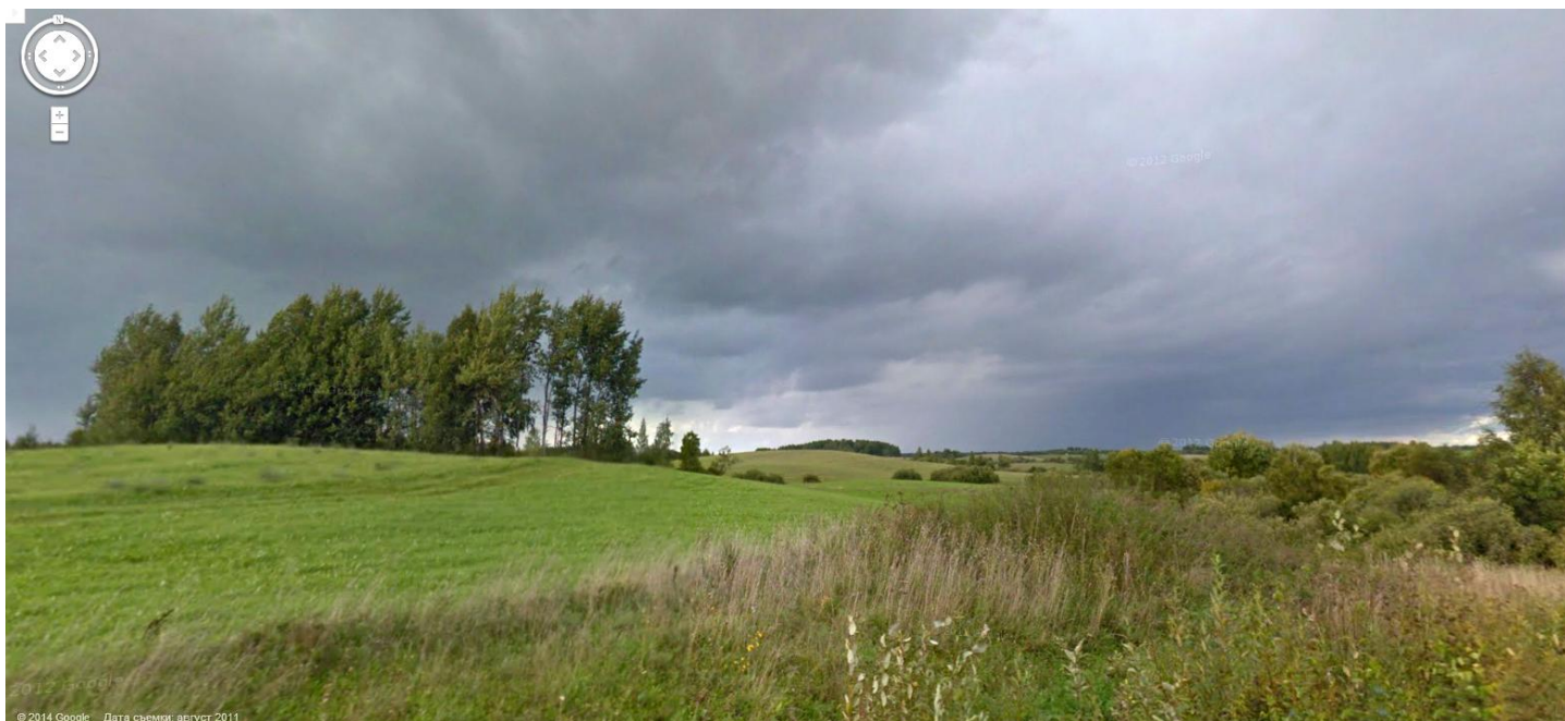
Те поля (сегодняшнее фото от Карты Google).

Месяц в поле пролетел — и не заметили. Наш срок вышел, а еще не все поля обработаны. Руководство совхоза упросило декана оставить нас еще на неделю, чтобы успеть завершить посевную. Теперь наша шумная гусеничная вереница вползала по извилистым дорогам на невысокие холмы меж сельских погостов, заброшенных хуторов с пустыми глазницами изб и перелесков. Склоны даже тех холмов засевались зерновыми.