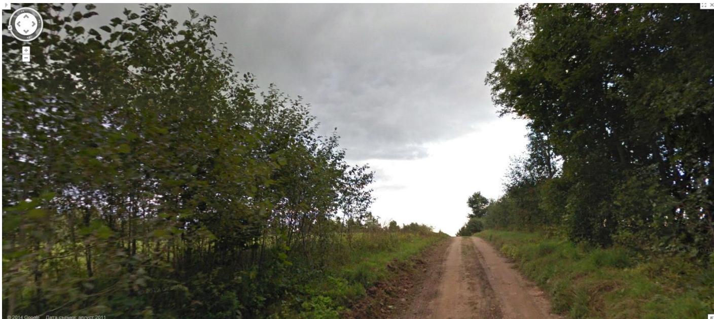
Вершина (сегодняшнее фото от Карты Google).

Зубья культиватора в пашне, бороны наготове. Вперед, на верхушки деревьев!