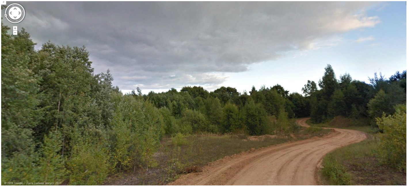
Даже на этот глухой просёлок забрался Google!