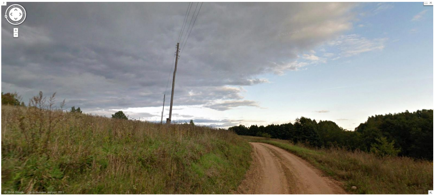
сегодняшнее фото