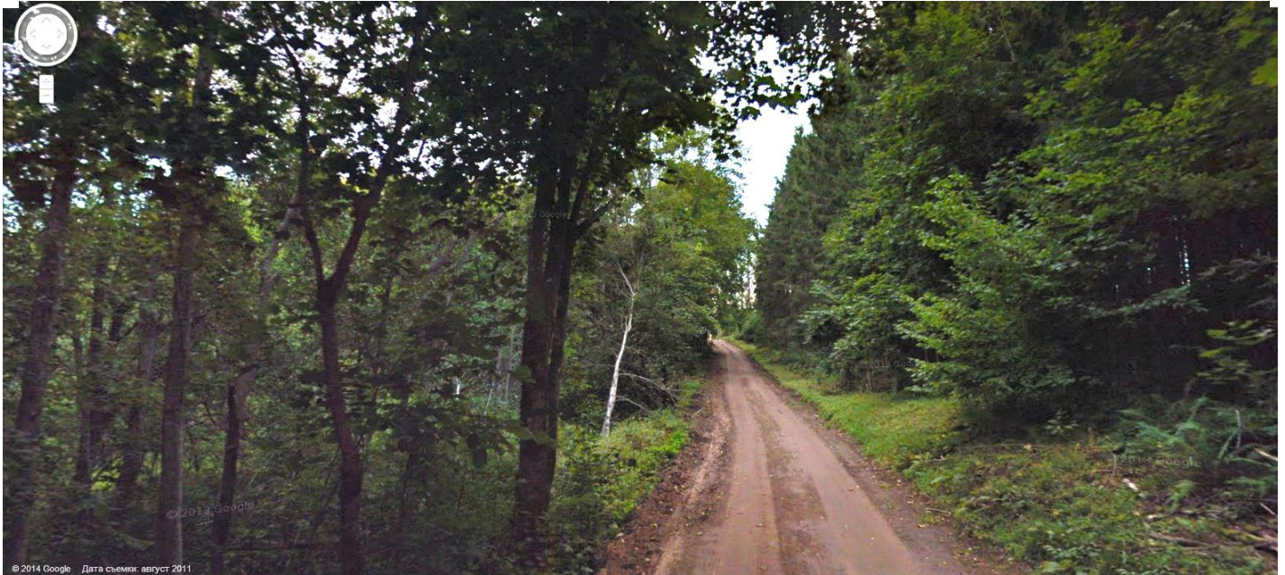
Слева уже совсем заросший заброшенный хутор.

А какие необъятные пейзажи открывались нашим взорам из запыленных окон кабин.