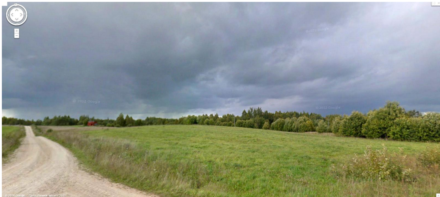
Те поля (сегодняшнее фото от Карты Google).